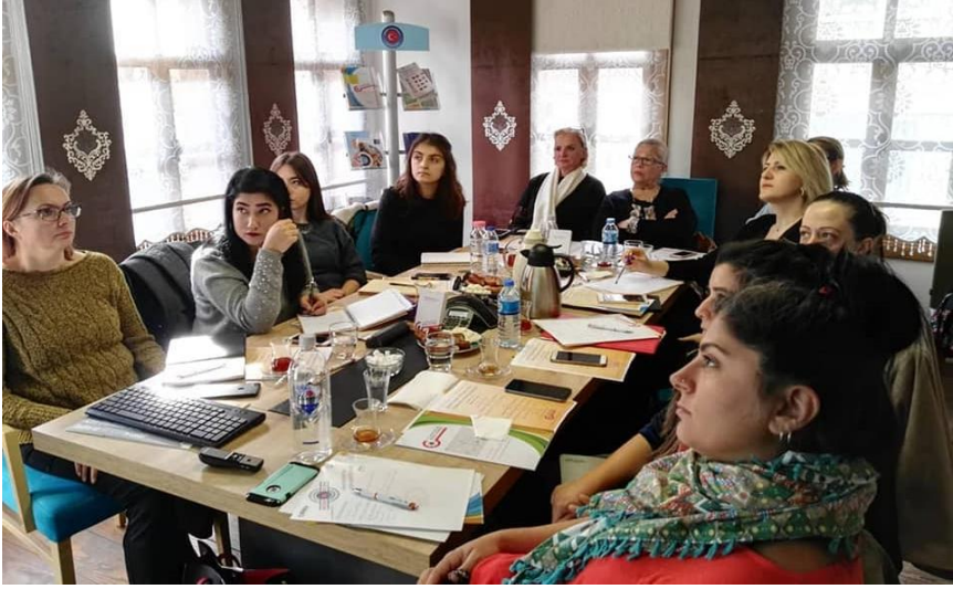
Stratejik planlama ekibi toplantımızdan...